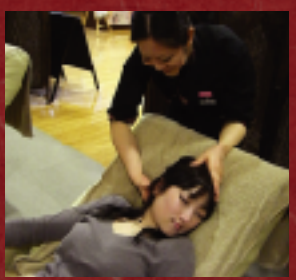
首や肩もほぐしてくれる「ヘッドケア」。 お試しコース20分(1,800円)〜。