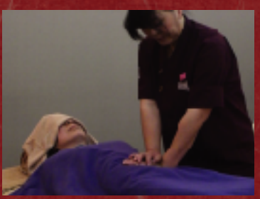
適度な力で腸を刺激し、お腹の 調子を整えます。50分(4,000円)。

今年導入された新メニューで、お腹や背中を温めながら、背中・腰・ お腹のツボを刺激してくれます。体温が1度上がると、免疫力は5 倍にアップするそうで、花粉症にも効くとのこと。普段刺激するこ のないお腹に適度な圧力をかけ、凝りやすい背中や腰のほか、 肩や足も丁寧にほぐしてくれます。施術後は体が軽くなったよう でした。服を着たままで気軽に受けられますよ！