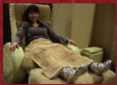
血液やリンパの流れも良くなる「泥パック」。 ヘッドケアとセットで30分(2,800円)〜。

最近登場した足裏デトックス。ミネラルやビタミンが豊富なフランス産の 海泥を足裏にパックします。5分程すると発熱がピークに達し、血行が良 くなり、温熱と各種成分の相乗効果で足の疲れも解消されます。パックを はずした後も足の裏はポッカポカ！頭や顔のツボを刺激しほぐしてくれる ヘッドケアは、頭痛や肩こりにも効果あり。施術中にウトウトしてしまう気 持ち良さですよ！