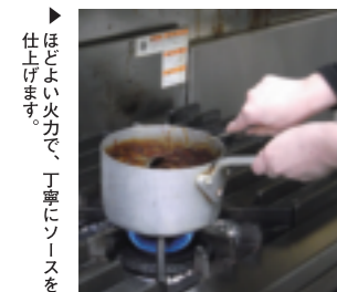
▶ ほどよい火力で、丁寧にソースを仕上げます。

オーブンはガスを使用しています。とくにチーズケーキはガスとの相性が良く、思い通りに焼き上がりやすい。ピザの生地もパリッと焼けるので、ガスはとても重宝です。