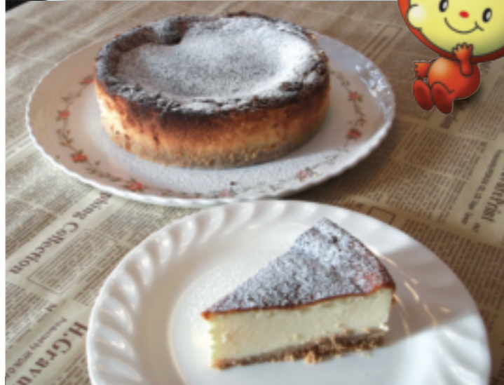
1.自家製の生地とソースを使用し、さまざまな具とゴーダチーズをたっぷりのせて焼き上げた「ミックスピザ」単品1,000円、ランチセット(サラダ・飲み物付き)1,200円。 2.シンプルで濃厚、一度食べればやみつきになる「ベイクドチーズケーキ」ワンカット320円、ケーキセット680円、ホール3,500円。ネット通販もあります。

材料の配合と焼き方にこだわった自家製ベイクドチーズケーキはリピートしたくなるおいしさ!