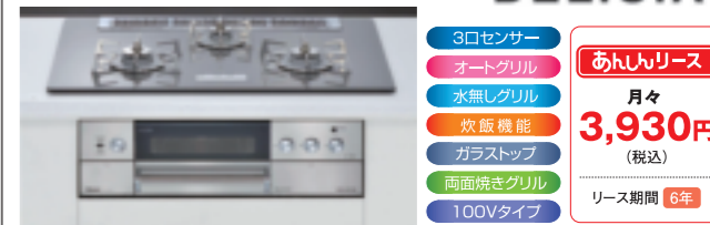
リンナイ 水無し両面焼きオートグリル付 ガラストップコンロ RHS71W10G7V-S(L,R) (75cmタイプ)