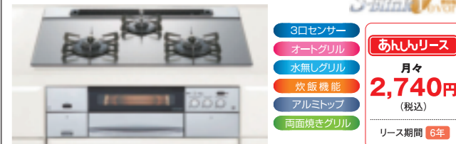
ハーマン 水無し両面焼きオートグリル付 アルミトップコンロ C3WL4PWAABSV (75cmタイプ)